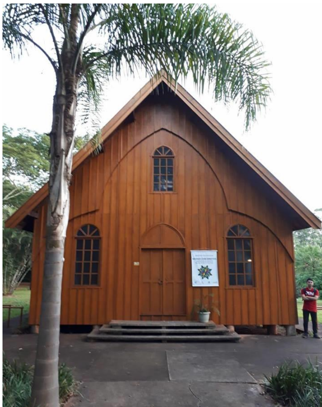
Figura 1 – Tarefa

Pedimos aos estudantes que descobrissem a altura da capela a partir da foto e demos um tempo para que eles pensassem em uma estratégia para resolver o problema.