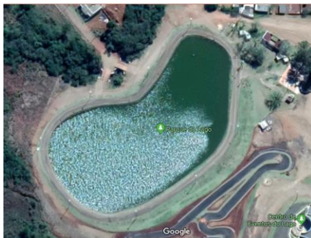
Figura 1 - Lago do Parque Municipal