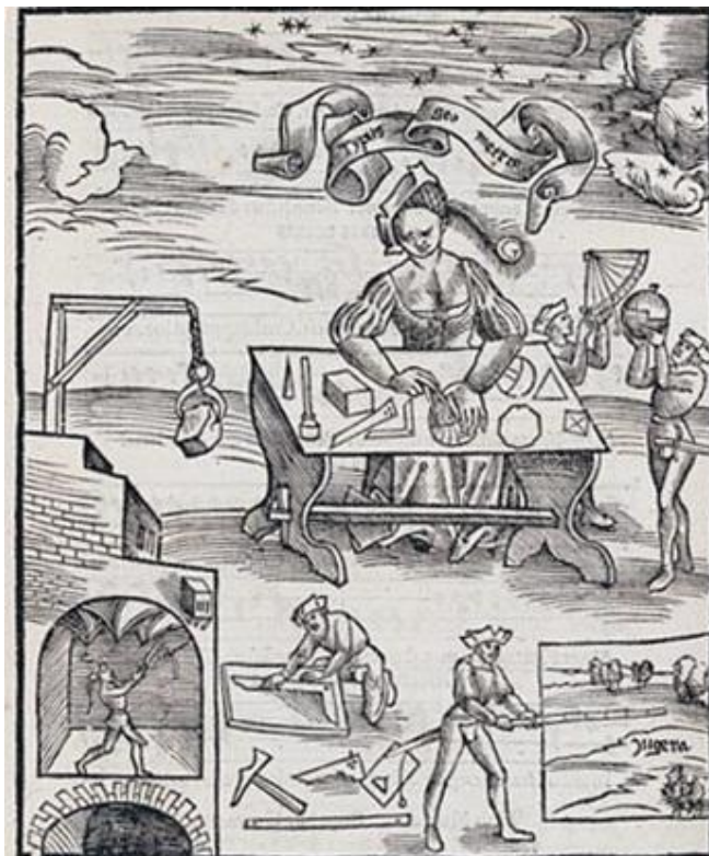
Figura 2 – A Geometria em Margarita Philosophica

Há também na imagem, à direita da mulher, que está sentada na mesa, dois homens, o primeiro mais próximo da mesa segura um Quadrante 3 e aponta o olhar para o céu, ao seu lado, o segundo homem, também olhando para céu, segura uma espécie de globo nas mãos.