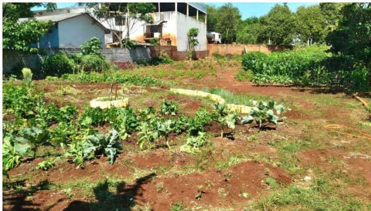
Figura 1 - Horta onde os alunos auxiliam no cultivo de plantas e verduras.

outros alimentos. O cultivo da horta (figura 1) faz parte do programa Mais Educação 3 , que é um projeto trabalhado dentro do governo estadual a partir de 2014, específico para a questão do campo.