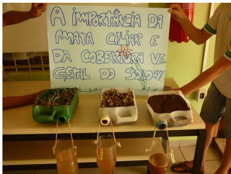
Figura 5 - Alunos percebem na prática a importância da mata ciliar

A figura 5 mostra um exemplo de como foi trabalhada a importância do cultivo da mata ciliar por meio do que os alunos já conhecem no campo.