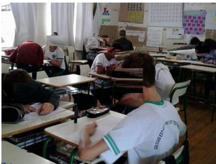
Figura 2 - Sala de aula dividida em grupos para as aulas.

A fim de promover a organização dentro de sala de aula e preparar os alunos para a sociedade, a sala de aula foi planejada (figura 2), segundo o diretor, como um grupo de trabalho, onde a turma é dividida em equipes de quatro estudantes para as aulas, onde um aluno é o coordenador. Cada turma possui dois líderes, um menino e uma menina e dois professores, eleitos pela classe escolar. Os grupos e o coordenador mudam a cada trimestre, o que para o diretor estará contribuindo para a formação de lideranças, para se trabalhar no coletivo, um diferencial na formação desse aluno na luta por seus direitos de cidadão.