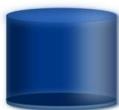
Figura 6 - Cilindro