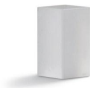
Figura 5 – Paralelepípedo