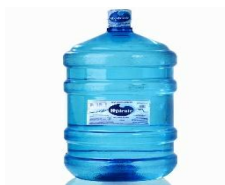
Figura 1 - Galão de Água